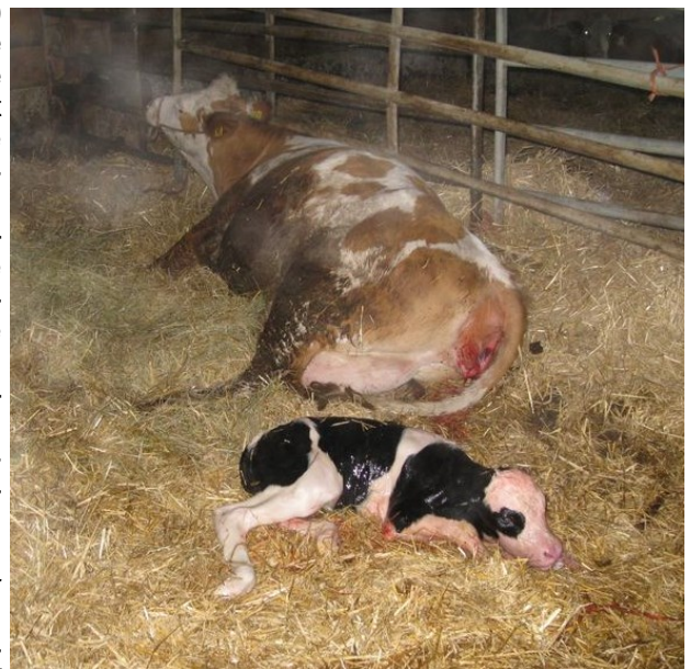
Abb.: Bei Geburten kommt es zu einer massiven Keimausscheidung. Sehr hygienisches Arbeiten ist von größter Wichtigkeit.

Wenn also der Verdacht besteht, dass eine Herde eventuell mit Q-Fieber infiziert sein könnte, weil einige oder mehrere Symptome passen, wendet Euch bitte vertrauensvoll an uns, wir beraten euch gerne. Sollte sich der Verdacht erhärten testen wir auch sehr gerne kostenfrei euren Bestand mittels einfacher Tankmilchprobe.